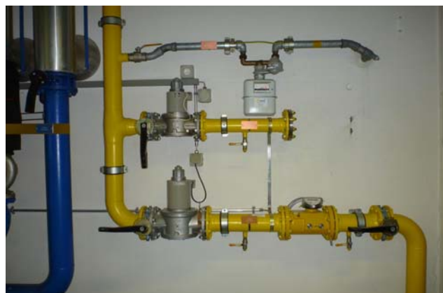
1 Freiverlegte Erdgasleitungsanlage

Periodische Kontrollen nach der Inbetriebnahme der Gasinstallation erhöhen die Sicherheit wesentlich. Die gesamte Gasinstallation ist in Intervallen, die von der Gasversorgung festgelegt werden, auf Dichtheit und Zustand zu kontrollieren. Das Ergebnis der Kontrollen ist zu dokumentieren.